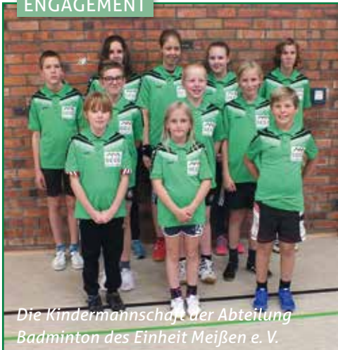
Die Kindermannschaft der Abteilung Badminton des Einheit Meißen e. V.