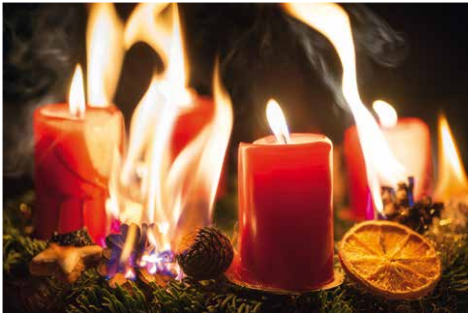
Weit verbreitet und sehr beliebt. Ohne Aufsicht kann sich der Adventskranz jedoch schnell zur Gefahrenquelle entwickeln.

Besitzt er in einem solchen Fall keine Privathaftpflichtversicherung, so müssen Schäden möglicherweise aus der eigenen Tasche bezahlt werden. Dabei handelt es sich nicht um Einzelfälle, bestätigen Statistiken. Laut einer Veröffentlichung in der Zeitschrift Finanztest im Jahr 2014 verzichten 15 Prozent aller Haushalte in Deutschland auf eine Privathaftpflicht. Ohne Hausratversicherung sind nach Angaben des Gesamtverbandes der Deutschen Versicherungswirtschaft 20 bis 25 Prozent der Haushalte. Natürlich muss jeder selbst über seinen persönlichen Versicherungsschutz entscheiden. Mieter sind nicht verpflichtet, Versicherungen abzuschließen. Es empfiehlt sich jedoch, eine unabhängige Ver-