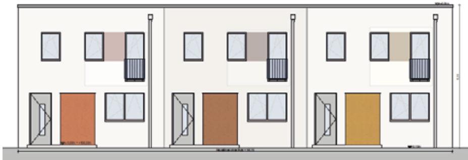
Modern – die neuen Reihenhäuser auf den Grundstück Siebeneichener Straße 45

Die Mitarbeiter der städtischen Wohnungsgesellschaft freuen sich ganz besonders auf dieses Haus. Im hinteren Bereich des Grundstückes Siebeneichener Straße 45, deutlich zurückgesetzt von der Straße, entsteht der erste Neubau der SEEG: drei moderne Reihenhäuser mit jeweils 105 m 2 Wohnfläche auf zwei Etagen, in direkter Nachbarschaft zu einem Landschaftsschutzgebiet. Jedes Haus